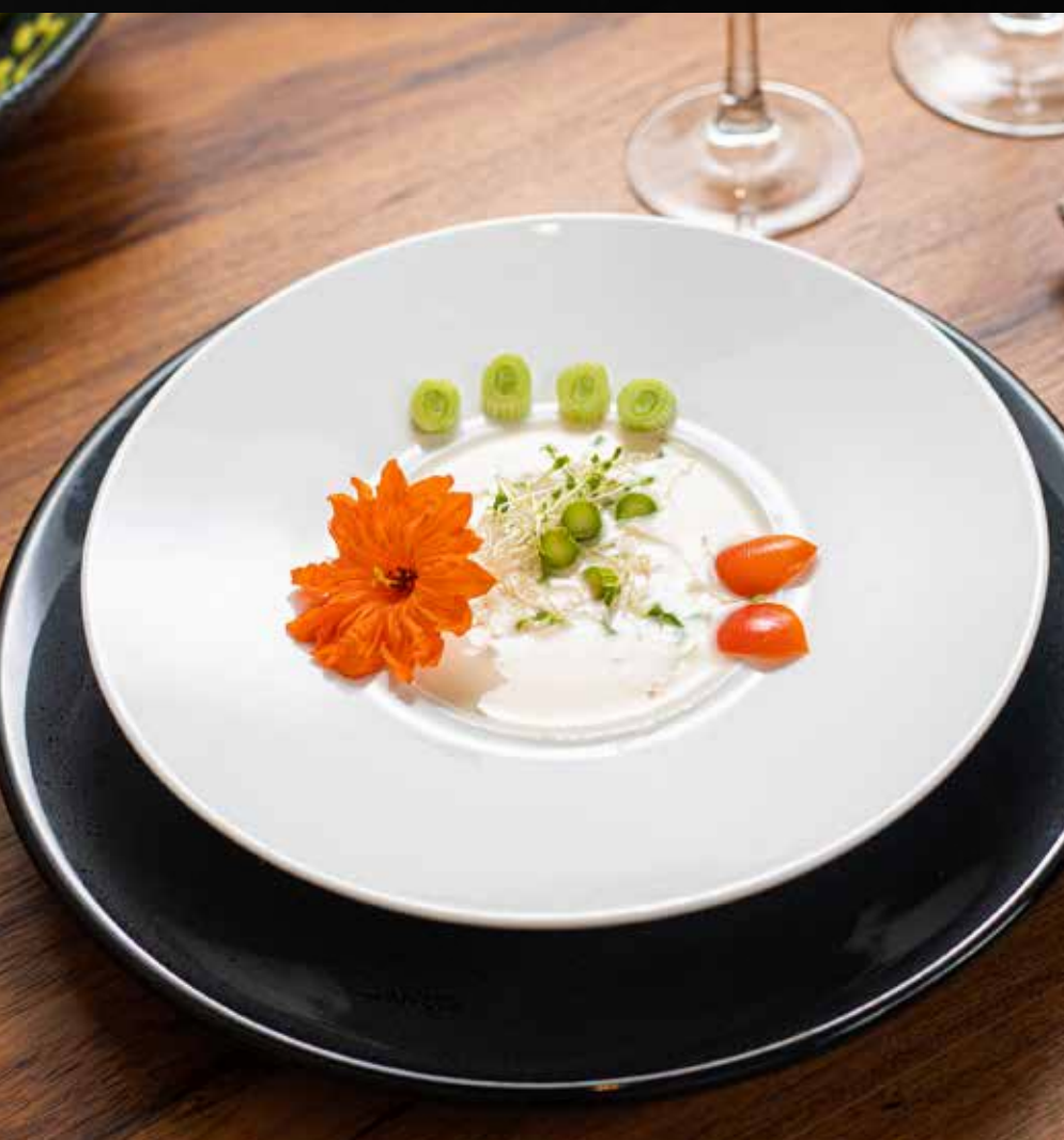
CREMA DE ESPÁRRAGO Hecha de espárrago blanco.