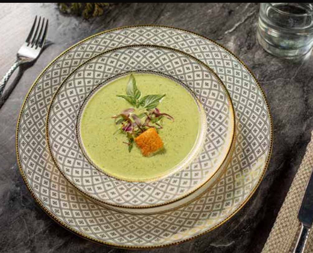
CREMA DE CALABAZA Crema hecha de calabaza con cilantro.